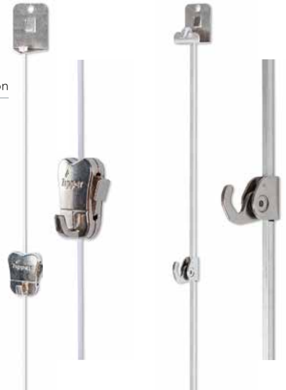
Kits de suspension