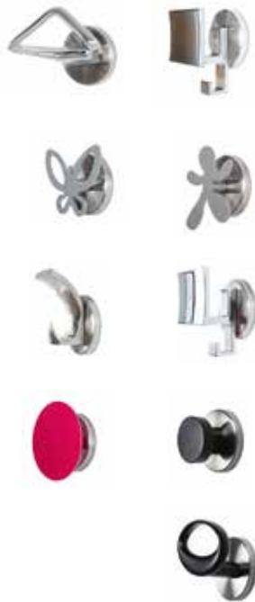
Patères métalliques et colorées