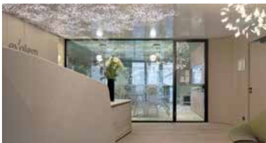
Evolem Lyon (69)