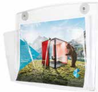
Porte-document transparent déplaçable