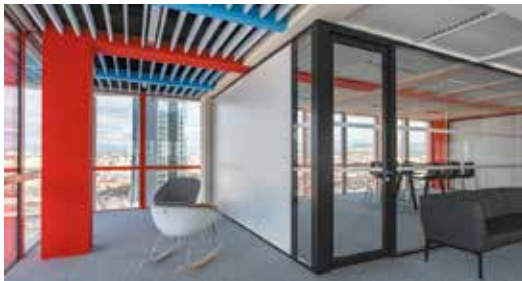
Tour La Marseillaise Marseille (13) Une réalisation PRO CONCEPT (84)