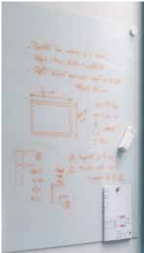
Verre laqué magnétique