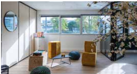
Siège SII Balma (31) Une réalisation ESPAZO (31)