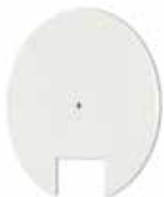
Kit d'aimantation pour accessoires légers