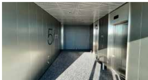
Framatome Lyon (69)