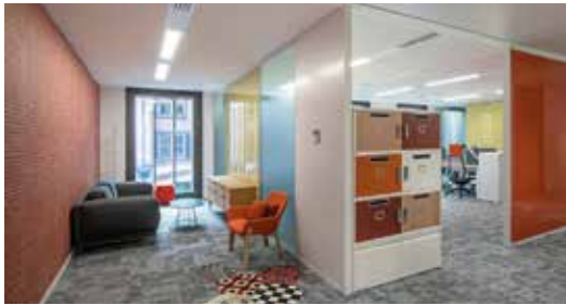
Société Générale • Le Conex Lille (59)