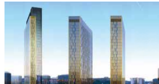
Cour de Justice de l'Union Européenne Luxembourg