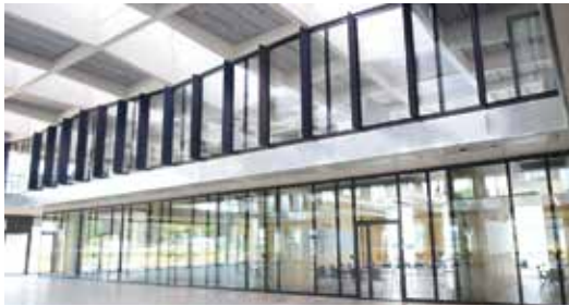
Siège Hager • Grande halle Obernai (67)