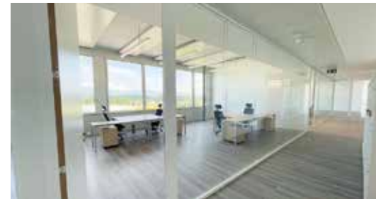
Selexis Genève (Suisse) Une réalisation TRISAX (Suisse)