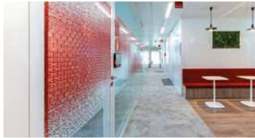
Siège RATP Fontenay-sous-Bois (94)