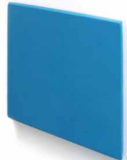
Panneaux pour ajuster l'ambiance acoustique de votre espace