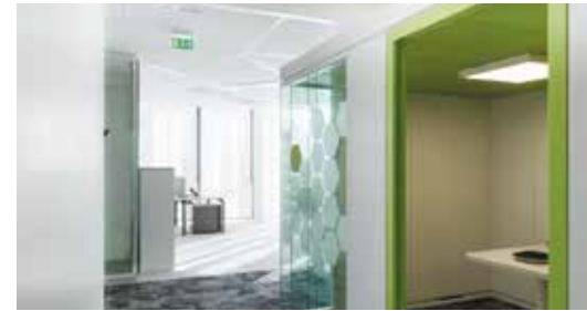
EDF Lyon (69)