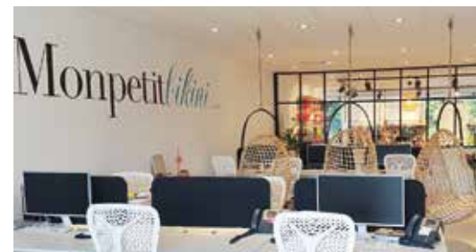
Mon Petit Bikini Mouans-Sartoux (06) Une réalisation AUROCH (06)