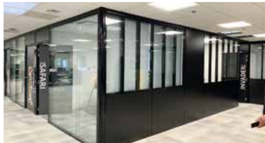
Siège Somfy Cluses (74) Une réalisation ALBERT & RATTIN (73)