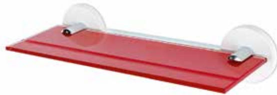
Tablette pour vos feutres