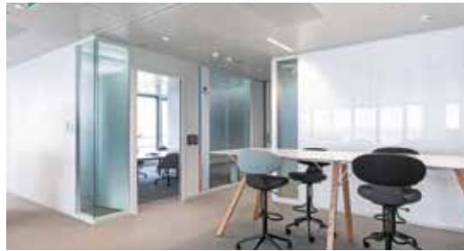
Tour St Gobain • La Défense Courbevoie (92)