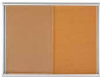
Vitrine d'affichage légale