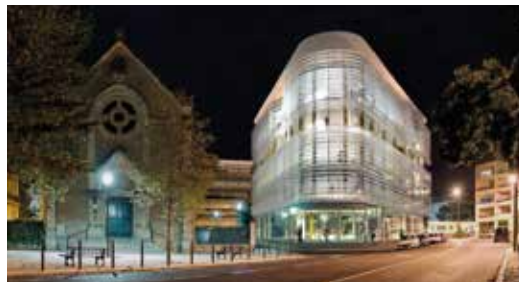
Gazechim Béziers (34) Une réalisation 3D CONCEPT (30)