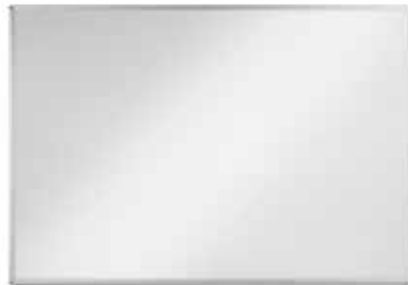
Tableau blanc classique